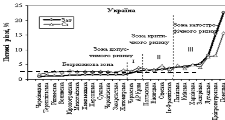
Рис. 2. Вплив забруднення атмосфери на стан здоров'я населення, 2005-2010 рр.

шкідливих речовин проявляється в зростанні показників захворюваності й смертності від хвороб органів дихання. Вплив забруднення атмосферного повітря на стан здоров'я відображено на рис. 2, який побудовано за даними паралельного ряду.