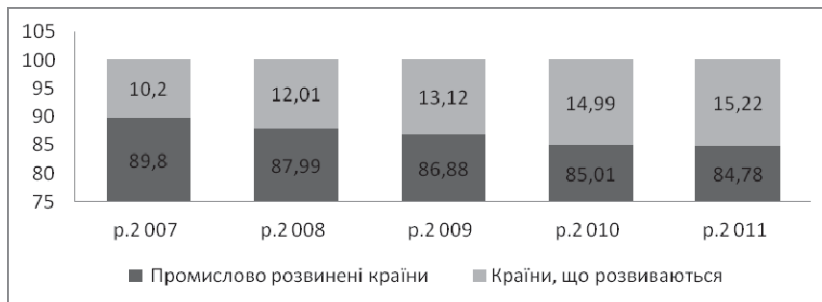
Рис. 1. Структура світового страхового ринку в розрізі зібраних страхових премій промислово розвинених країн та країн, що розвиваються, в 2007-2011 роках, %

зменшилася з 89,8% до 84,78%, тобто, на 5,02%: в 2008 році – на 1,81%; в 2009 році – на 1,11%; в 2010 році – на 1,89%; в 2011 році – на 0,23%. Відповідно частка страхових премій, зібраних країнами, що розвиваються, зросла на 5,02%, і на сьогодні становить 15,22 % (рисунком 1).