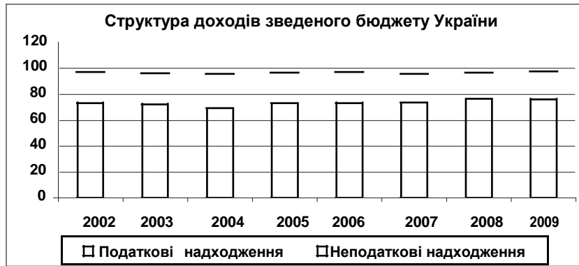
Рис. 1. Динаміка структури доходів Зведеного бюджету України у розрізі податкових та неподаткових надходжень упродовж 2002-2009 років*

*Джерело: складено і розраховано автором за даними Міністерства фінансів України: [сайт]. – Режим доступу: http://www.minfin.gov.ua/control/uk/publish/archive/main?cat_id=77440 . – Назва з екрана.