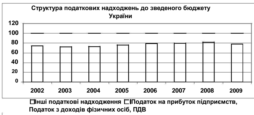
Рис. 2. Структура податкових надходжень до Зведеного бюджету України*

Загальна структурна динаміка вище вказаних податків у податкових надходженнях є такою (рис.2).