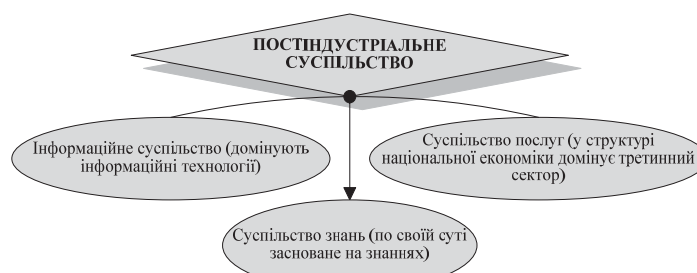
Рис. 1. Підхід до розуміння постіндустріального суспільства (розроблено автором)

За визначення UNPAN між даними, інформацією й знаннями такий взаємозв'язок: дані можна побачити безпосередньо; інформація – це сукупність даних, об'єднаних у кластер вищого рівня, якому притаманні зміст і значимість, а пройшовши через фільтр сприйняття і думок (когнітивна здатність), інформація стимулює різноманітні дії та види діяльності; знання беруться з даних і будуються на основі інформації, вони належать людям і схиляють їх до тих або інших дій в конкретних обставинах [23]. Таке визначення знань має практичний аспект. Звідси слідує, що постіндустріальне суспільство не можна характеризувати тільки як інформаційне. Як зазначалося вище, постіндустріальне суспільство можемо називати інформаційним із-за домінування інформаційних технологій.