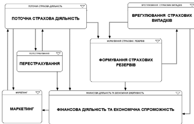
Рис. 1. Структура модельного комплексу "Управління страховою компанією"

Відповідно до цілей та стратегії компанії розроблено комплекс імітаційних моделей (модельний комплекс) управління діяльністю страхової компанії (рис. 1). За допомогою якого проаналізовано втілення головних бізнес-процесів страхової компанії із визначенням системи показників їх ефективності. Реалізація розробленого модельного комплексу дозволяє: дослідити динаміку розвитку страхової компанії; отримати множину імовірнісних характеристик результатів страхових, перестрахових та інвестиційних операцій; провести оцінку чутливості результатів діяльності страхової компанії до впливу різноманітних стохастичних чинників; здійснити оцінку альтернативних стратегій розвитку страхових операцій та знайти кількісні параметри управлінських рішень; реалізувати прогнози головних характеристик бізнес-процесів на задану часову перспективу.