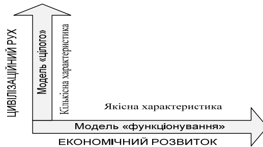
Рис. 3. Горизонтальний та вертикальний розвиток у розумінні секторальної структури

ня та забезпечення їх гармонійного розвитку під впливом певного інституціонального середовища (рис. 3).