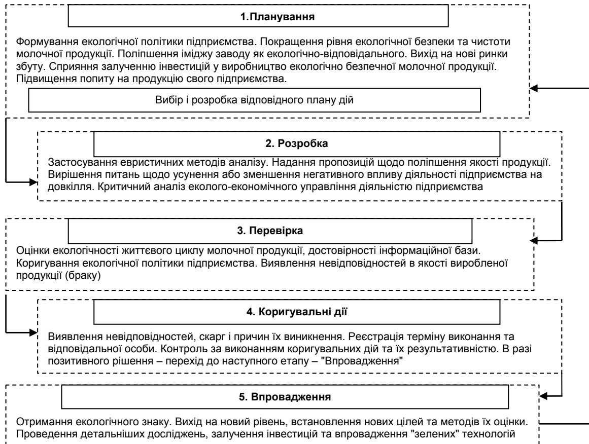
Рис. 2. Схема впровадження екологічного маркування на молокопереробних підприємствах України

пов'язано ще з однією проблемою, яка існує в Україні, а саме – недопустимо малим є штраф, передбачений статтею 156 1 Кодексу про адміністративні правопорушення, за порушення прав споживачів.