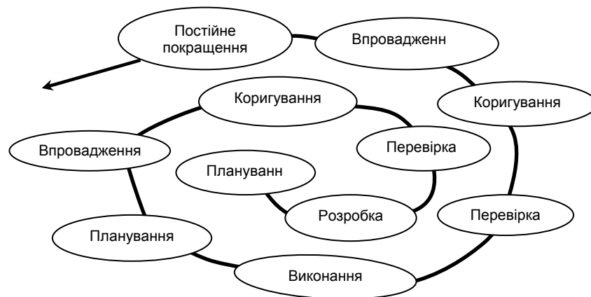
Рис. 1. Впровадження управління життєвим циклом продукції на молокопереробних підприємствах

В Україні, як і в усьому світі, екологічне маркування продукції, незважаючи на свою добровільність, розглядається на державному рівні як складова екологічної політики та системи інтегрованого еколого-економічного управління. Основним критерієм екологічності продукції в екологічному маркуванні виступає оцінка її впливу на навколишнє природне середовище на усіх стадіях життєвого циклу виробництва (рис. 1). Таким чином, вітчизняна молочна продукція вважатиметься екологічно чистою та безпечною для споживання, якщо весь процес її виготовлення буде таким. Ретельне вивчення стадій життєвого циклу дозволяє визначити низку критеріїв, які враховують вимоги до ряду факторів, що виявляються екологічно небезпечними.