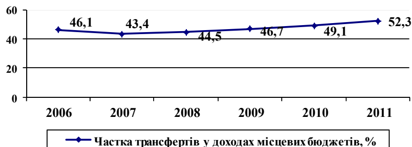
Рис. 3. Питома вага міжбюджетних трансфертів з державного бюджету у доходах місцевих бюджетів (%)

Загальний обсяг наданих із державного бюджету трансфертів місцевим бюджетам збільшився порівняно з 2009 р. на 15 млрд. 460,7 млн. грн., або на 25,1 відс., а питома вага трансфертів у доходах місцевих бюджетів за 2011 рік досягла 52,1 відс., або зросла на 3,2 відс. пункти (рис. 3.), що суперечить вимогам схваленої розпорядженням Кабінету Міністрів України від 23.05.2007 № 308-р Концепції реформування місцевих бюджетів, основним завданням якої визначено підвищення рівня самодостатності місцевих бюджетів [5 с.58].