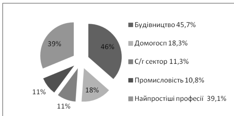
Рис.4. Основні сфери працевлаштування українських трудових мігрантів [27]

пов'язано, як із менш сприятливою ситуацією для фахового працевлаштування жінок в Україні, так і з потребами ринку праці зарубіжних країн у послугах із догляду та піклування, де переважно працевлаштовуються жінки.