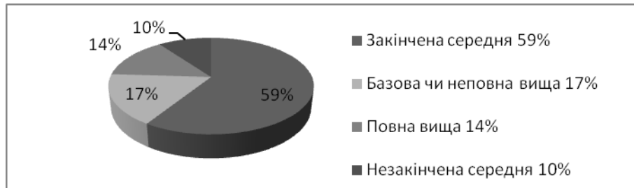
Рис.3. Рівень освіти українських трудових мігрантів [10]

ту" у світлі наявної невідповідності між навичками мігрантів і тими посадами, які вони обіймають. Лише деяким мігрантам вдається знайти роботу за кордоном відповідно до рівня їхньої освіти. Більшість займається низькокваліфікованою роботою. Ця невідповідність прослідковується якщо порівняти сфери працевлаштування мігрантів за кордоном (Рис.4) з їхнім рівнем освіти (Рис.3).