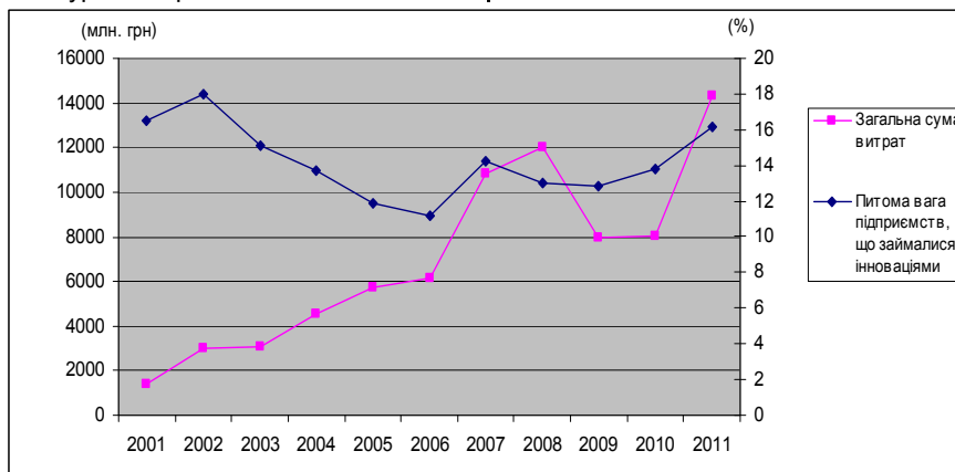
Рис. 3. Динаміка інноваційно активних підприємств України в 2001-2011 рр.

Одним з найважливіших показників, що характеризує інноваційну сферу економіки, є частка інноваційно-активних підприємств, тобто питома вага підприємств, що активно проводять інноваційну діяльність (рис. 3). Наведені дані на рис. 3 свідчать про недостатній рівень інноваційної активності підприємств України. Так, у 2011 році лише 16,2 % підприємств займалися інноваційною діяльністю, тоді як у 2002 р. – 18 %. При цьому загальна сума витрат на здійснення інновацій в 2011 р. становила 14333,9 млн.грн.