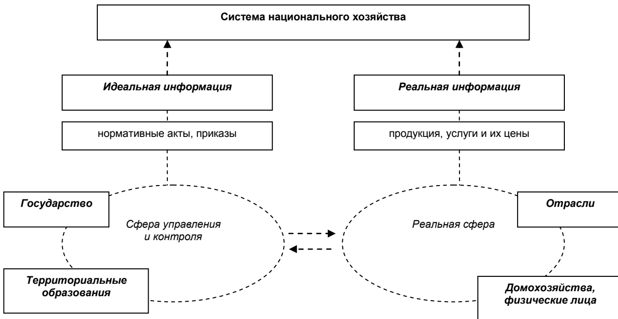
Рис. 2. Сферы национального хозяйства

деленность развития. Иерархия в системе национального хозяйства относительна: любой ее уровень (подсистема) обладает известной степенью автономии. Элементы и подсистемы национального хозяйства функциональны, то есть само существование или какой-либо вид проявления части обеспечивает существование или какую-либо форму проявления целого, равно как существование целого обеспечивает существование своих частей, подсистем в том виде, как они есть [4]. Через свои подсистемы и элементы национальное хозяйство взаимодействует с другими национальными хозяйствами, мирохозяйственной системой в целом.