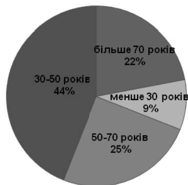
Рис. 2. Розподіл шахт України за термінами експлуатації

При цьому тривалий період панування командно-адміністративної економіки та "залежність від пройденого шляху" сприяли формуванню в Україні інституційної структури, що генерує формальні та неформальні бар'єри, які перешкоджають становленню цивілізованих рентних відносин. Загально визнано, що реформування національної економіки в 90-ті роки XX століття характеризувалися інкрементними інституційними змінами та прагненням в короткі терміни звільнити економіку від державного втручання. Наслідком цього стало формування "рентної економіки", що характеризується розпорошеністю влади між олігархічними кланами, домінуючим інтересом яких є не економічний добробут усієї нації, а перерозподіл наявних ресурсів через державний бюджет та отримання тих чи інших привілеїв.