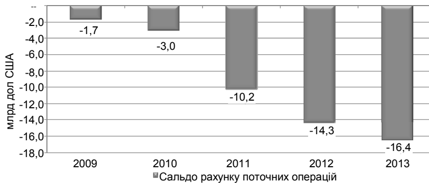
Рис. 1. Динаміка сальдо рахунку поточних операцій в Україні у 2009-2013 роках, млрд дол США