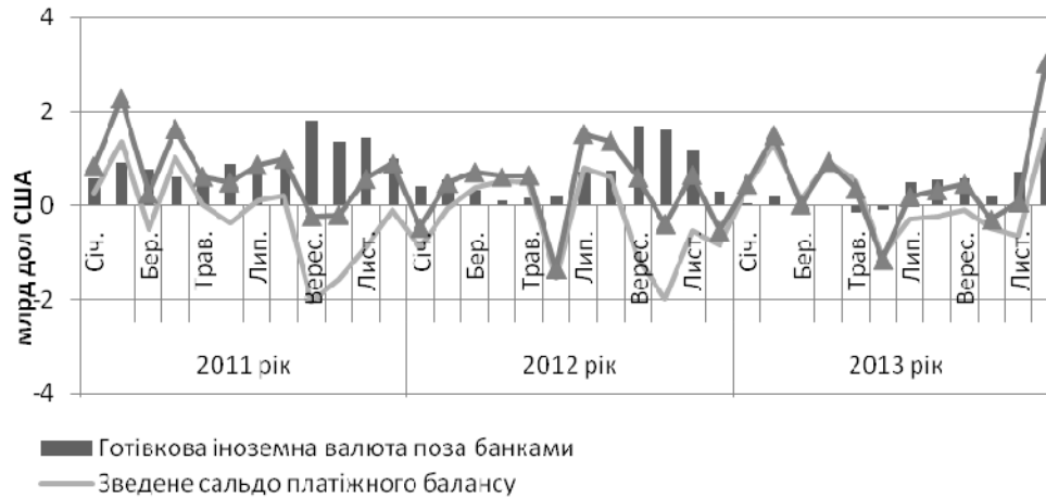
Рис. 3. Приріст готівкової іноземної валюти поза банківськими установами в Україні у 2011-2013 роках, млрд дол США