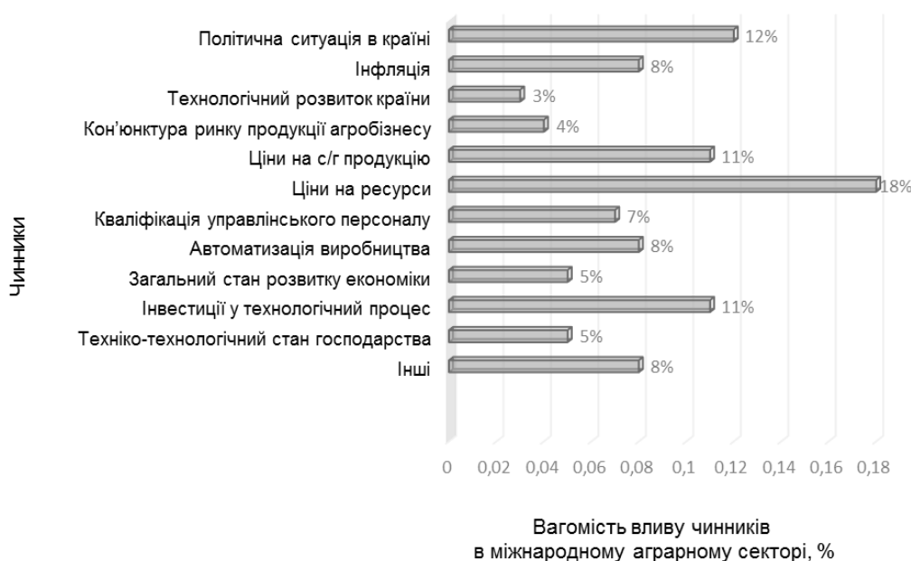
Рис.2. Співвідношення чинників глобалізації на міжнародний аграрний сектор