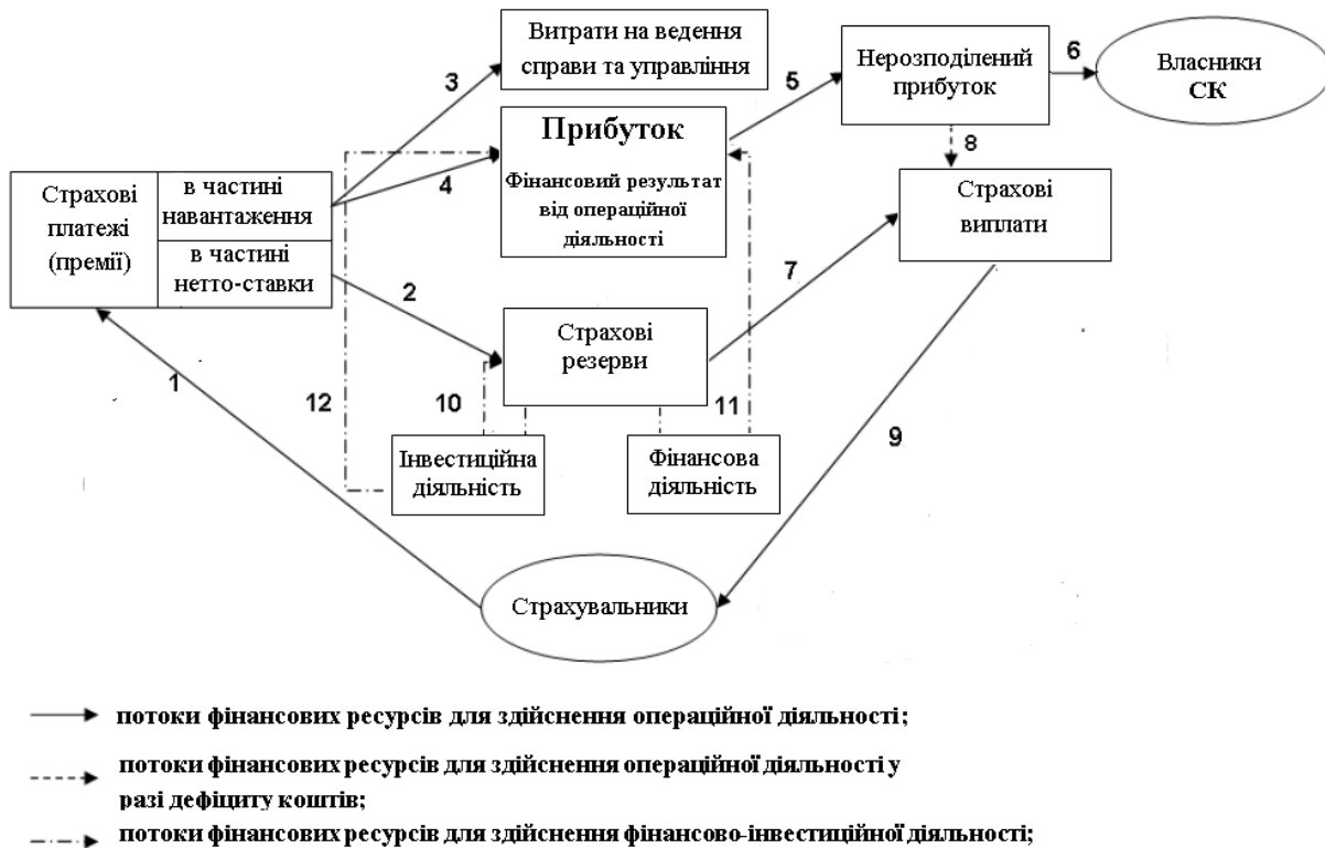
Рис. 1. Схема руху фінансових ресурсів страхової компанії у процесі операційної діяльності

прибуток страховику (стрілки 10–12). Стрілками 1–9 на схемі відображений основний операційний цикл страхування. Стрілками 10, 11, 12 на схемі зображені потоки фінансових ресурсів у стадії інвестування.