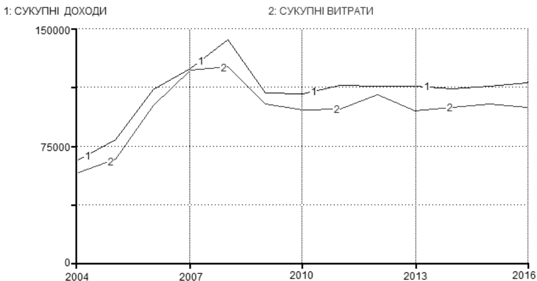
Рис. 4. Доходи та витрати страхової компанії

На період з 2004-2011 рр. витрати розраховуються на основі фактичних даних, а на період 2012-2016 рр. здійснюється прогноз (на базі методу системної динаміки, основних принципів ведення страхової справи та стратегії ведення бізнесу компанії) [11, 12] (рис. 4).