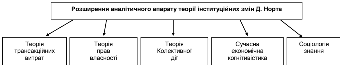
Рис. 2. Розширення аналітичного апарату теорії інституційних змін Д. Норта

Джерело: Складено автором за даними [4; 5]