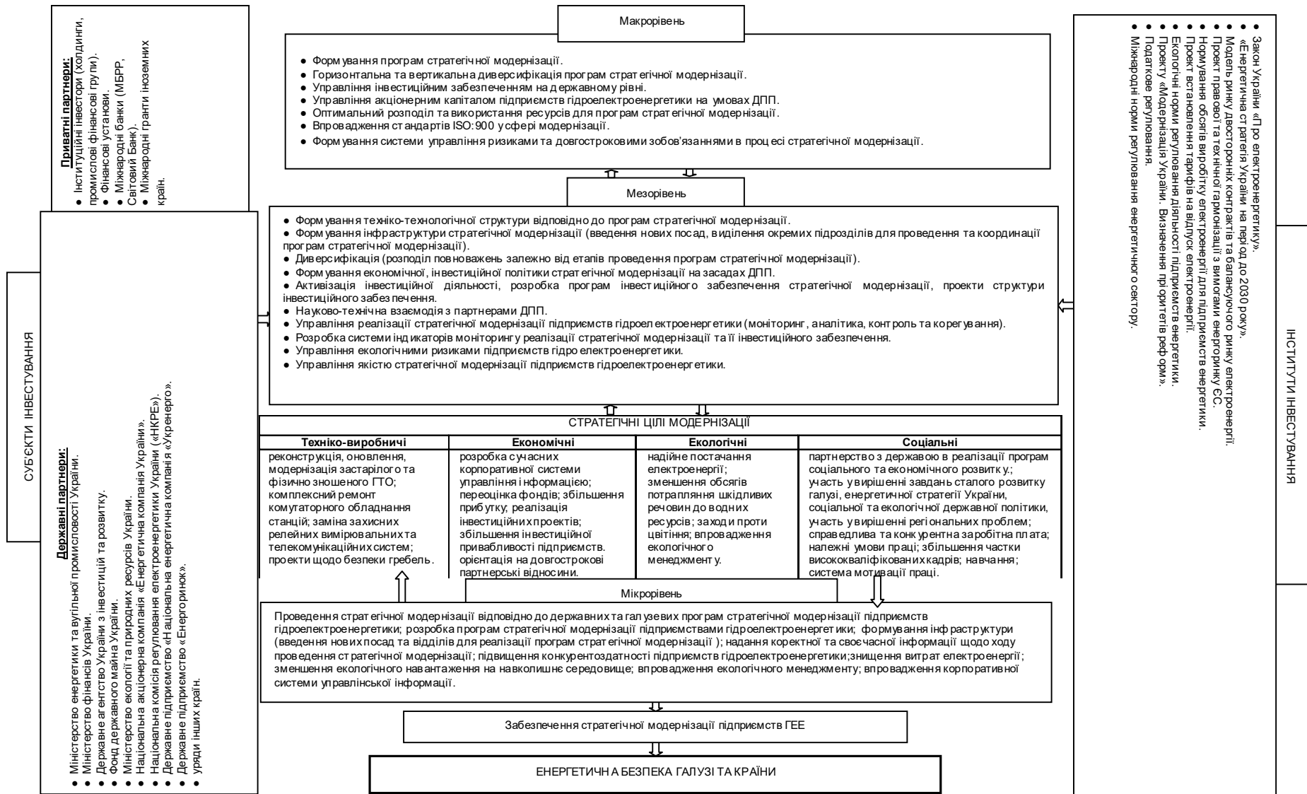
Рис. 3. Механізм стратегічної модернізації підприємств гідро електроенергетики*