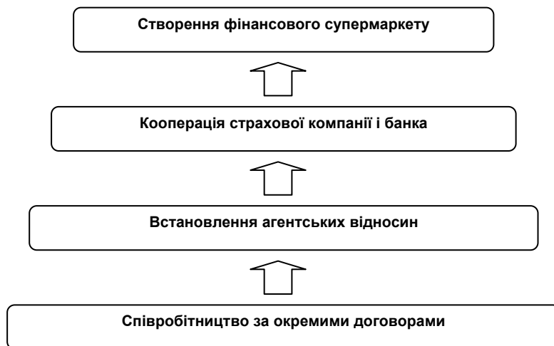
Рис. 2. Рівні співпраці страхових компаній і банків

Що ж являє собою фінансовий супермаркет ?