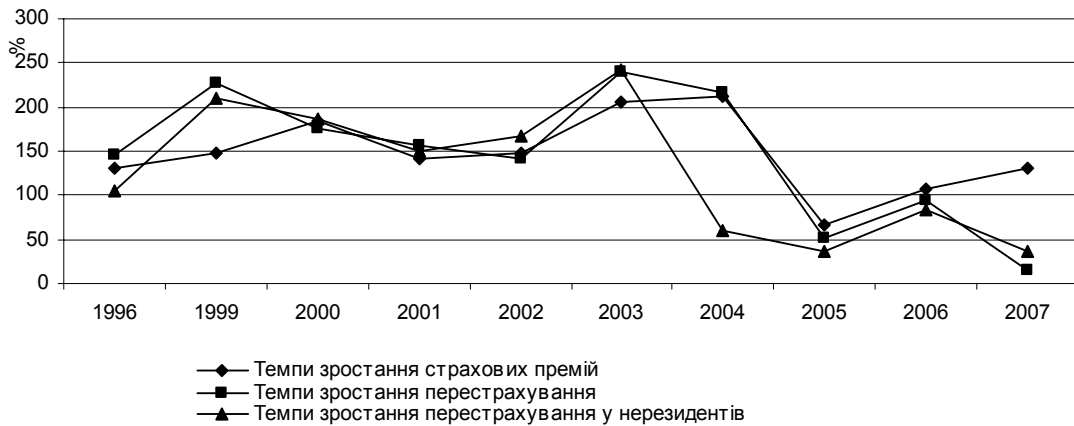
Рис. 2. Динаміка перестраховування ризиків

Аналіз динаміки перестраховування ризиків свідчить, що вона також була стихійною та невірноваженою (рис. 2).