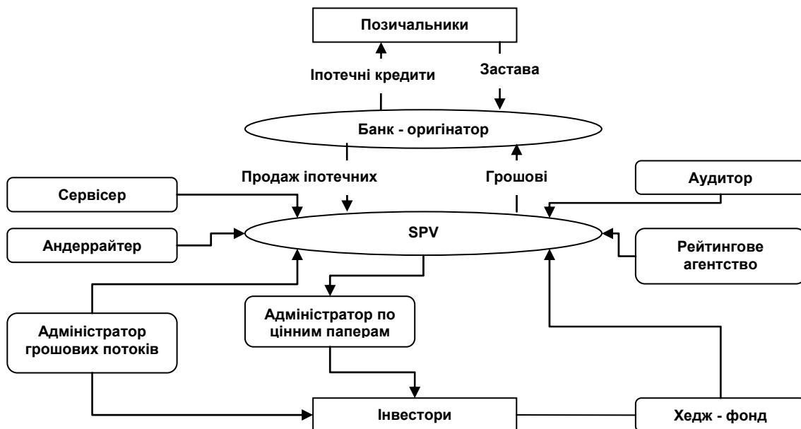
Рис. 1. Механізм класичної сек'юритизації на основі дійсного продажу.

пейський ринок сек'юритизації має певний запас міцності, що обумовлено вищою якістю активів, що підлягають сек'юритизації. В цьому аспекті також не можемо не відзначити той факт, що саме учасники європейського ринку сек'юритизації як шлях виходу з глобальної фінансової кризи пропонують запровадити жорсткіші вимоги до розкриття інформації щодо якості активів та підвищити вимоги рейтингових агенцій до їх оцінювання.