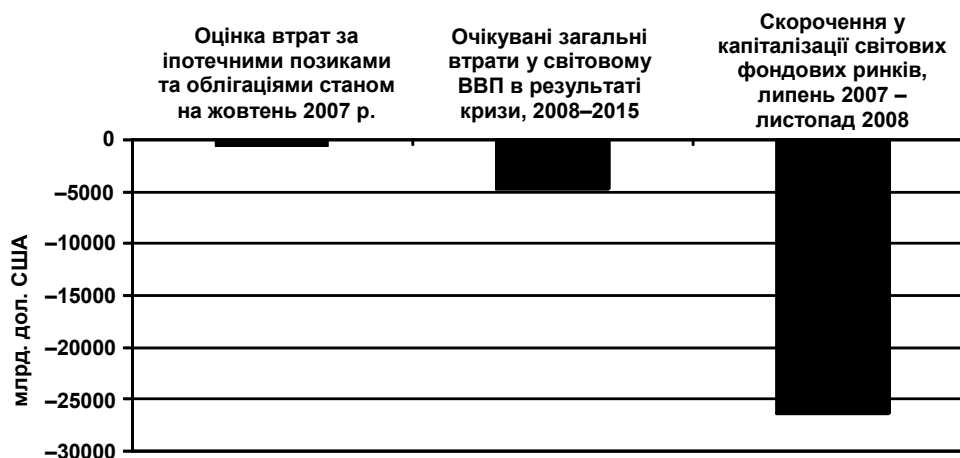
Рис. 1. Поширення іпотечної кризи США і наслідки для світової економіки 2

Тривалий час від початку світової фінансової кризи не лише українські політики, а й відомі міжнародні економісти 1 вважали, що нові економіки, включаючи Україну, є до певної міри захищеними. Премії, сплачувані урядами цих країн по відношенню до уряду США (державні спреди), були невисокими і суттєво не збільшувались до осені 2008 року. Однак восени ситуація різко змінилася, і згідно звіту Центру Карнегі [8], з 38 країн, досліджуваних за трьома показниками стабільності фінансового сектору, Україна разом з Угорщиною та Польщею у Європі, а також Аргентина та Ямайка опинилися серед найбільш постраждалих від фінансової кризи країн.