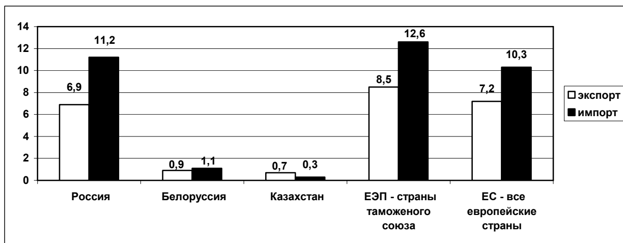
Рис. 1. Внешняя торговля Украины, млрд. долл.

Казалось бы, рынки ЕС более открыты и интересны для украинской продукции. В самом деле, ВВП стран Евросоюза в 2009 году достиг 16,5 триллиона долларов. Однако ВВП стран Таможенного союза в 2010 г. будет представлять, по прогнозам, 2 триллиона долла-