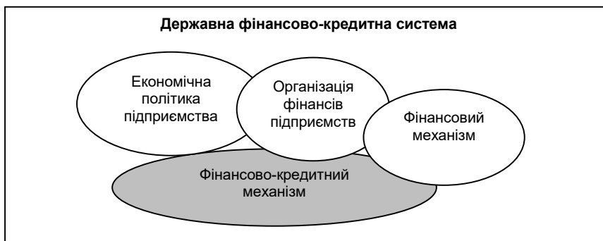
Рис. 2. Формування фінансово-кредитного механізму

розвитку підприємницької діяльності у туристичній галузі (мікrokредитування, пільгове кредитування, державне субсидювання, лізинг, тренінги з фінансово-кредитних питань для туристичних підприємств). Схема формування фінансово-кредитного механізму подано на рис. 2.