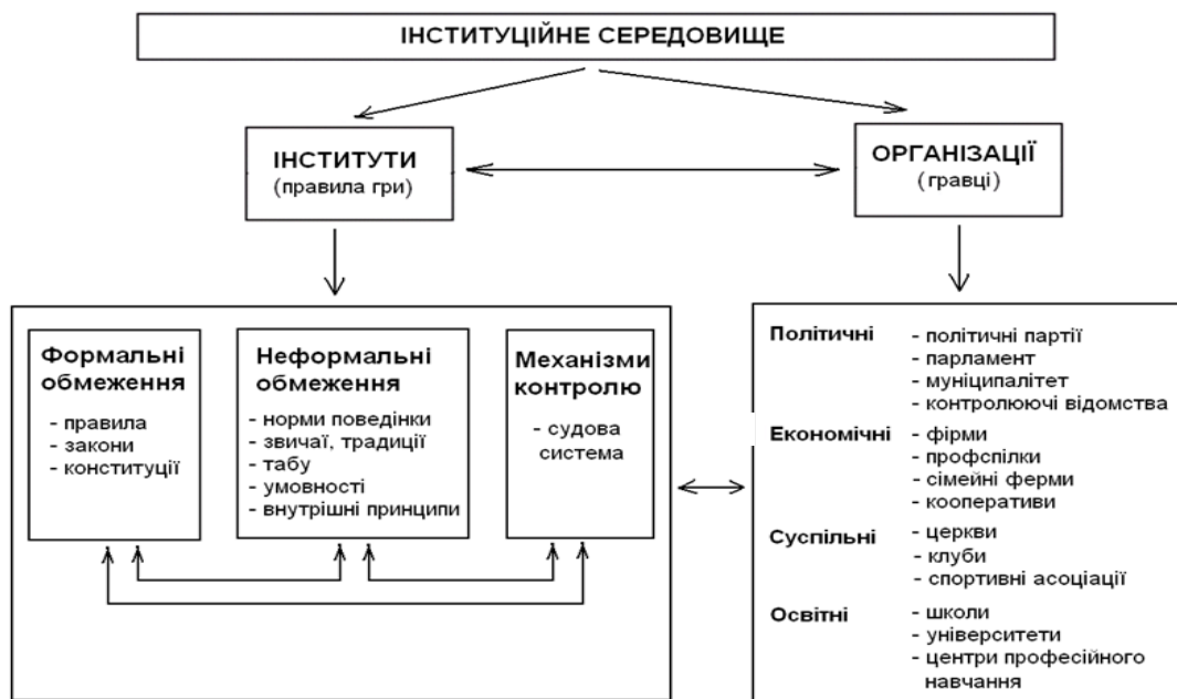
Рис. 1. Інституційне середовище (за D. North)

Інституційні зміни, що відбуваються, визначають, як суспільство розвивається в часі, якщо формальні правила можна змінювати швидко, то неформальні потребують більше часу, адже вони вироблялися протягом століть і навіть тисячоліть. Ці культурні норми пов'язують минуле з сьогоденням і майбутнім та надають розуміння траєкторії історичного розвитку. Організації можна розглядати в якості агентів інституційних змін. Взаємодія інститутів та організацій створює інституційне середовище (див. рис.1).