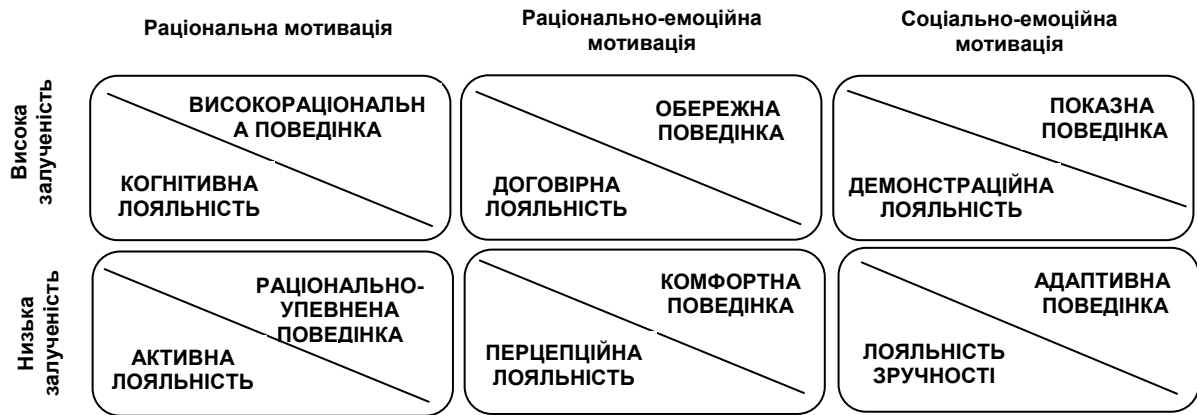
Рис. 3. Типи споживчої лояльності на українському ринку високотехнологічних товарів

За результатами проведеного дослідження нами складено типологію поведінки кінцевих споживачів на вітчизняному ринку високотехнологічних товарів на основі факторів залучення споживачів до процесу купівлі та типу рішення про покупку. Відповідно до кожного типу поведінки визначимо та надамо змістовну характеристику типам лояльності, які потенційно можна сформулювати у споживача (рис. 3).