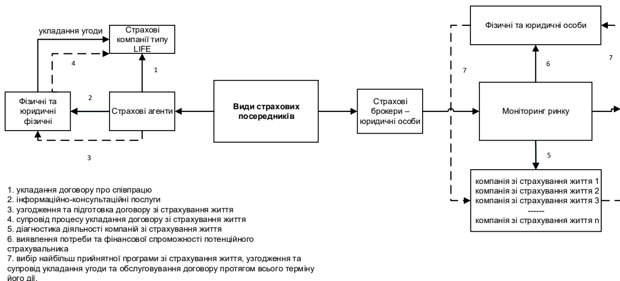
Рис. 2. Функціонування страхових посередників в організації страхування життя

сфері страхування життя як страхових брокерів, так і страхових агентів. Проте доречно звернути увагу на особливості їх функціонування (рисунк 2).