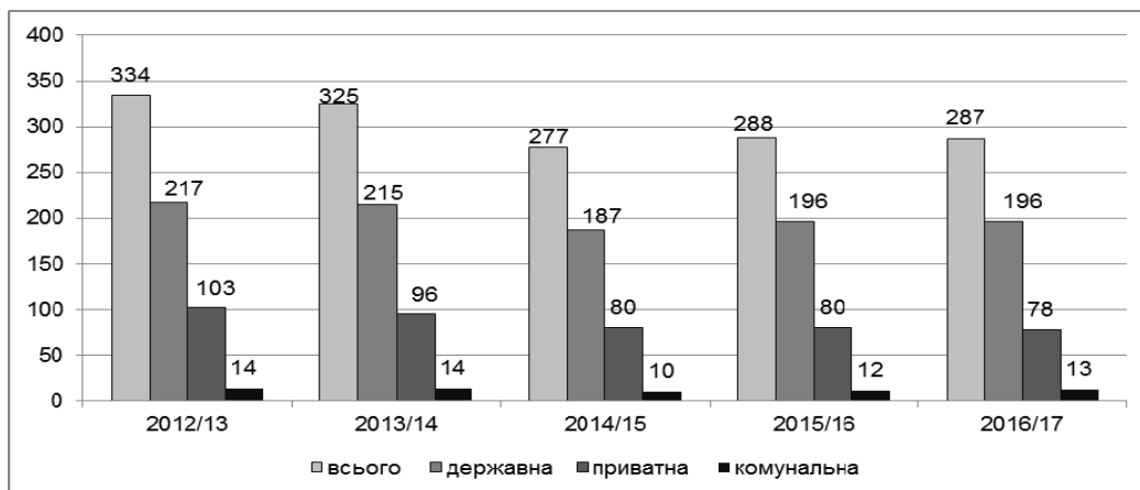
Рис. 2. Кількість ВНЗ України III-IV рівня акредитації за формами власності станом на початок відповідного навчального року, од.