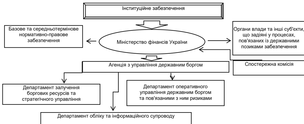
Рис. 2. Модель інституційного забезпечення в Україні

З огляду на відсутність в Україні позитивного емпіричного досвіду управління державним боргом, неврегульованість процедур його контролю та відсутність системи моніторингу пропонуємо впровадження трикомпонентної моделі інституційного забезпечення цього процесу. Вона передбачає виділення відносно відокремленої інституційної структури – агенції або комітету, підпорядкованої Міністерству фінансів України, чиї функції будуть зосереджені навколо виконання трьох головних завдань у системі управління державними запозиченнями, а саме залучення боргових ресурсів та прийняття стратегічних рішень щодо здійснення внутрішніх і зовнішніх позик, надання державних гарантій на основі базового нормативно-правового забезпечення, оперативне управління державним боргом і пов'язаними з ними ризиками та забезпечення обліку та інформаційного супроводу управління державним боргом. Основні складові частини моделі інституційного забезпечення в Україні розглянемо на рис. 2.