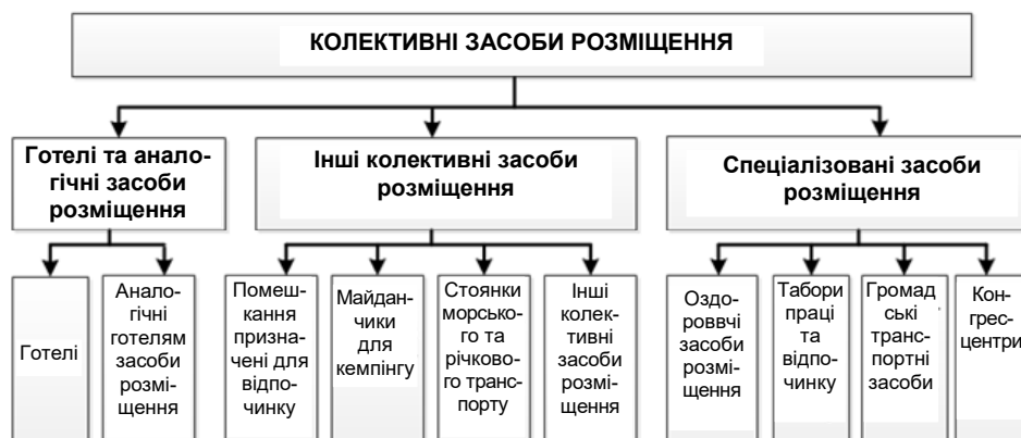
Рис. 1. Класифікація колективних засобів розміщення

Викладення основного матеріалу дослідження з повним обґрунтуванням отриманих наукових результатів. Відповідно до ДСТУ 4268:2003 ("Послуги туристичні. Засоби розміщення. Загальні вимоги") "засоби розміщення, призначені для проживання туристів" – це "будь-які об'єкти, в яких регулярно або час від часу надають послуги розміщення для ночівлі" [19, с. 1-2]. Їх поділяють на колективні та індивідуальні засоби розміщення [19, с. 2]. Згідно з вітчизняною нормативно-правовою базою колективні засоби розміщення (далі КЗР) становлять велику групу різних видів об'єктів, яку поділяють на три підгрупи (рис. 1) [19, с. 3-4]. У ній готелі виділяють окремим різновидом у першій групі. До них відносять безпосередньо самі готелі та засоби розміщення такі як мотелі, готелі квартирного типу, готелі у пристосованих транспортних засобах тощо [19, с. 3]. Також виокремлено рівнозначний різновид аналогічних готелям засобів розміщення (пансіонати, будинки відпочинку, туристичні бази тощо).